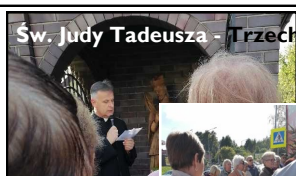
Św. Judy Tadeusza - Trzech Krzyży