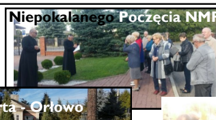
Niepokalanej Poczęcia NMP