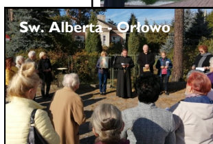
Św. Alberta - Orłowo