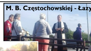
M. B. Częstochowskiej - Łazy