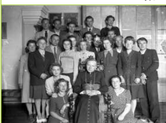
Bp Wyszyński z młodzieżą.

Rozpoczął odbudowę seminarium i katedry. Zreorganizował pracę kurii tworząc wydziały duszpasterski, gospodarczy i spraw szkolnych, wspierał odrodzenie stowarzyszeń religijnych i rozwijał wspólnoty różańcowe. Przy powołanej Caritas utworzył referat do walki z alkoholizmem zalecając, żeby przy parafiach powstawały „Bractwa Trzeźwości”. Zainicjował akcję duszpasterską, przygotowującą wiernych do pełnego i świadomego uczestniczenia we mszy, wyjaśniającą i uczącą ludzi tekstów liturgicznych oraz śpiewu, prowadzonego wówczas po łacinie. Jako biskup współredagował „Wiadomości Diecezjalne Lubelskie”. Przez trzy lata pracy w diecezji lubelskiej odwiedził 80 z 2444 parafii zaczynając od rejonów najbardziej zniszczonych przez wojnę. Wspierał zapał parafian w odbudowie kościołów. W listach pasterskich stawiał akcent na dwie sprawy. Pierwsza to odbudowanie moralności uświadamiając, że okrucieństwa wojny były rezultatem odrzucenia Boga przez człowieka.