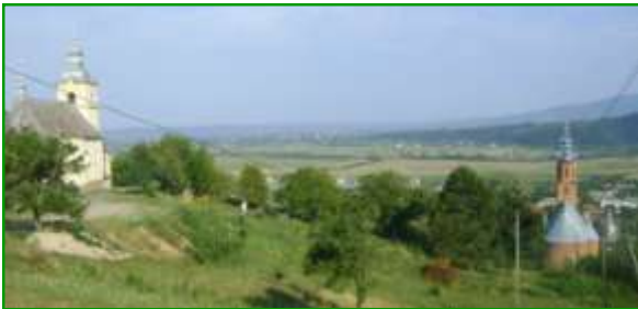
Widok na Imstyczewo i dolinę Borzawy