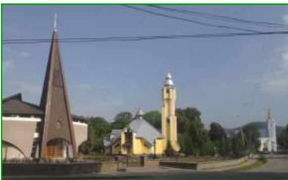
Świątynie w miasteczku Dovhe