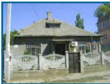
parafia p.w. św. Małgorzaty